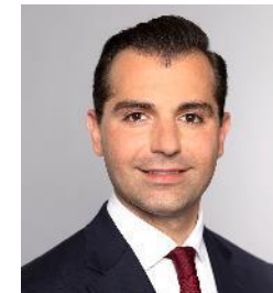
Volkan Top Rechtsanwalt

Capital Markets, Banking & Finance Hamburg