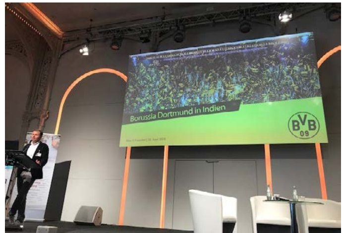
Auch die Fußball-Fans kamen nicht zu kurz und erhielten einen exklusiven Eindruck, wie Borussia Dortmund den indischen Markt erobert.

Vor dem Hintergrund der Wahlen und anderen aktuellen Entwicklungen in Indien diskutierten Unternehmer und Experten praxisnah Herausforderungen und Chancen auf dem indischen Markt – von Markteintritt und Kooperationen mit indischen Partnern über Vertrieb und Produktion bis hin zu Personalfragen und Outsourcing. Nach dem überraschend deutlichen Wahlsieg von Premier Modi erwarten viele Beobachter im In- und Ausland nun mutige Strukturreformen, um das Vertrauen ausländischer Investoren in Asiens drittgrößte Volkswirtschaft weiter zu stärken. In den Vorträgen und Panels verrieten Unternehmensvertreter von Großkonzernen und Familienunternehmen wie BMW, Lufthansa, Schueco und Dr. Oetker ihre „Erfolgsrezepte“ für den indischen Markt, sprachen aber auch die Schwierigkeiten und Fallstricke offen und direkt an, was von den Teilnehmern des INDIA DAYS sehr geschätzt wurde.